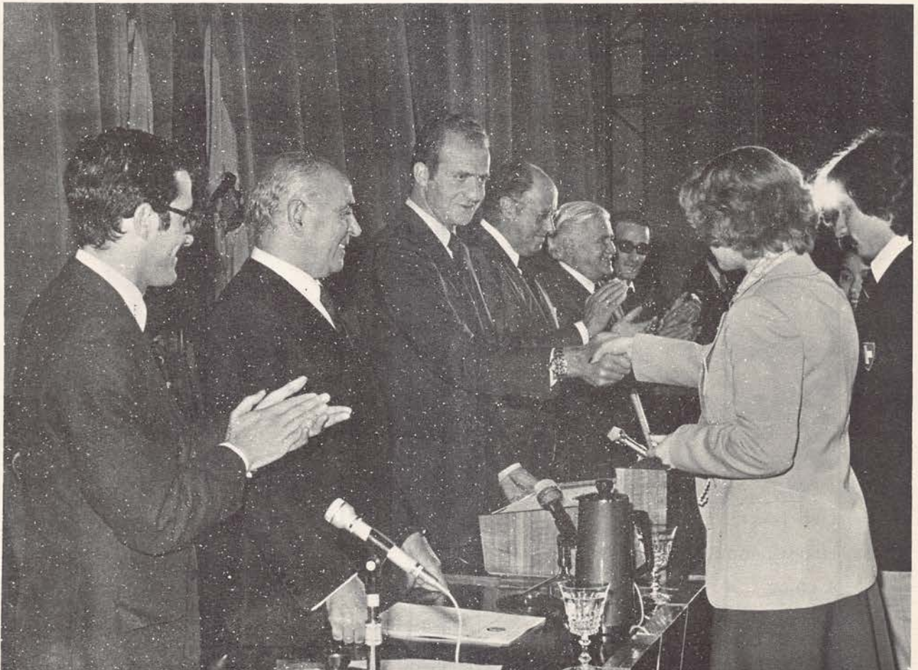
El entonces Príncipe de España, hoy Rey de los españoles, Juan Carlos I, presidiendo la entrega de premios del XXII Concurso Internacional.